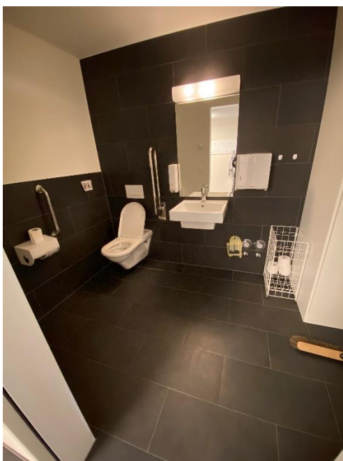
Grosses barrierefreies WC